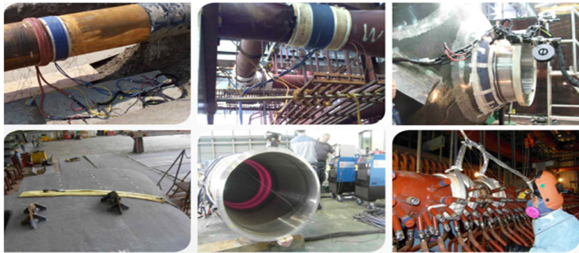
<RH35 열처리 적용 사례 - 한국멕케이용재(주)>